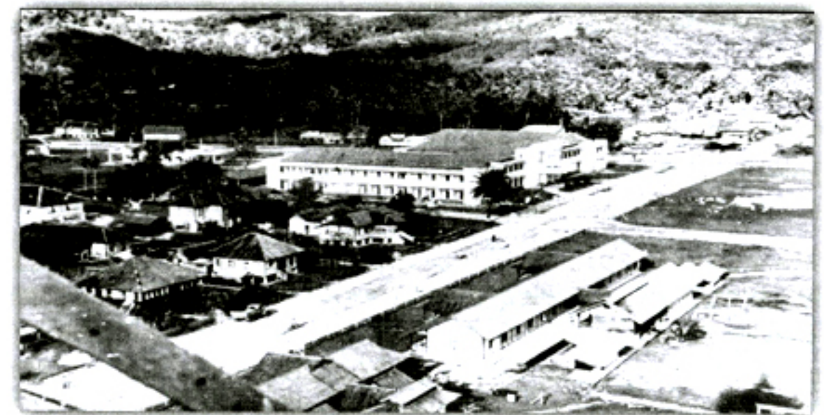
Dipetik dari Buku Kenang-Kenangan Sempena Memperingati 100 Tahun (1906-2006) Pembangunan Bandar Brunei di Darat.

Rancangan Negara Tahun 1953 Pertama merupakan satu usaha penting dalam pembinaan bangunan moden di Bandar Brunei. Dalam pembangunan yang pesat di bandar ketika itu menyebabkan pertambahan penduduk dan terbitnya masalah perumahan. Bagi menangani perkembangan ini, pihak Kerajaan telah menaikkan taraf Town Sanitary Board kepada Lembaga