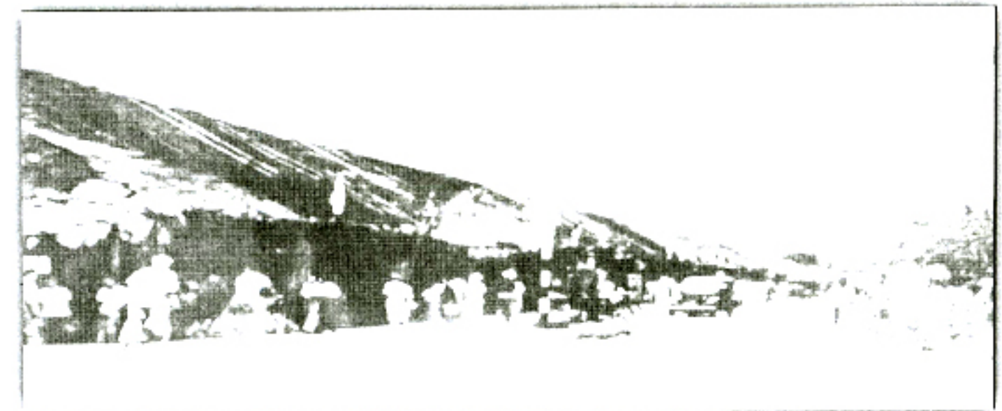
Dipetik dari Buku Kenang-Kenangan Sempena Memperingati 100 Tahun (1906-2006) Pembangunan Bandar Brunei di Darat .

Semua kedai Cina dari bandar di Kampong Ayer telah dirancang untuk dipindahkan ke daratan, satu perjanjian telah dibuat pada tahun 1910. Sebanyak 14 lot kedai yang dipohonkan telah dijual dan dimeteraikan. Pada 30 Jun 1910, enam buah kedai telah siap dibina dan pekedai-pekedai mula berpindah ke daratan dan sebuah Balai Polis telah ditempatkan. 4 Berbagai-bagai usaha telah dijalankan dengan menggalakkan pembukaan tanah termasuk cadangan memindahkan penduduk-penduduk Kampong Ayer ke darat telah dibuat. Perpindahan kerabat Diraja memberi galakan kepada