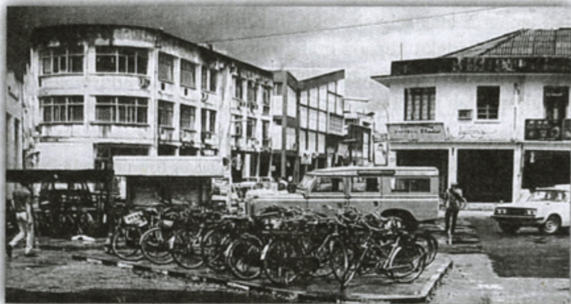
Dipetik dari Buku Kenang-Kenangan Sempena Memperingati 100 Tahun (1906-2006) Pembangunan Bandar Brunei di Darat.

Penempatan rumah dan kedai telah membuka sebuah bandar, dan pada tahun 1911, pembinaan masjid di daratan telah siap dibina. Ini mendorong penduduk kampung untuk berpindah ke darat. Peniaga Cina menganggap penempatan di darat akan menjadi pusat perdagangan yang maju pada masa akan datang.