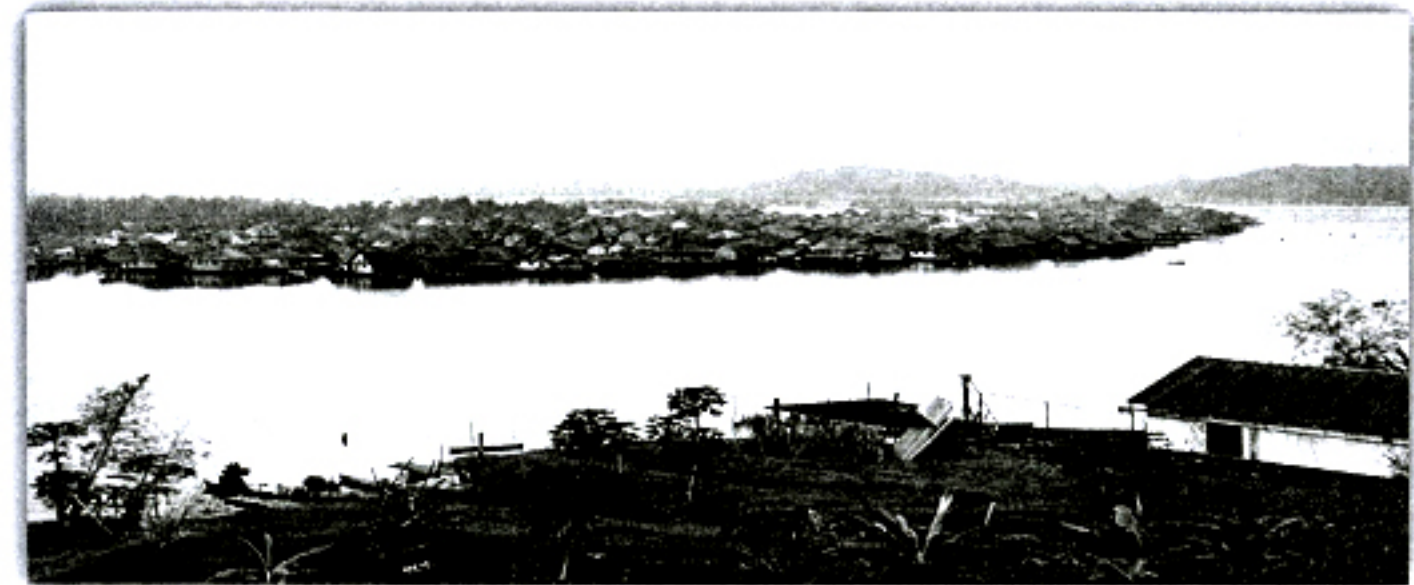
Dipetik dari buku The Golden Legacy Brunei Darussalam .

Penulis luar yang pernah datang ke Brunei menceritakan bahawa Bandar Brunei terletak di air. Sejak KM XVI hingga KM XX, Bandar atau ibu negeri Brunei masih lagi terletak di Sungai Brunei. Bandar atau ibu negeri Brunei sejak KM XVI hingga KM XX, masih lagi terletak di Sungai Brunei. Antonio